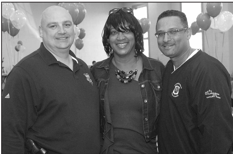
El pasado 23 de noviembre, el Club de Leones Portugueses de la ciudad de Elizabeth ofrecieron un almuerzo gratis a los residentes y clientes del Stephen Samson Center, un centro de cuidado y atención para personas de la tercera edad, ubicado en el 800 de Anna Street, y subsidiado por el Departamento de Salud y Servicios Humanos de la ciudad.

Feliz Navidad y Próspero Año Nuevo Les Desea LA VOZ